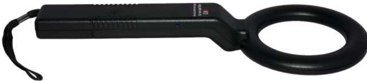
Рис. 1.1. Внешний вид

ЛКД МУ-04 01 – ручной досмотровый металлодетектор, который отличается высокой чувствительностью, компактностью, безопасностью и удобством в эксплуатации. Он специально разработан для обнаружения скрытых на человеке предметов, изготовленных из металлов и сплавов. Этот металлодетектор идеально подходит для обеспечения безопасности объектов, где необходимо предотвратить пронос запрещенных предметов.