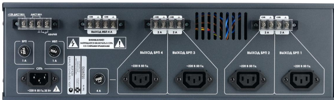
Рисунок 2. Внешний вид задней панели БРП.

Не светится при КЗ в нагрузке или при выключенном БРП.